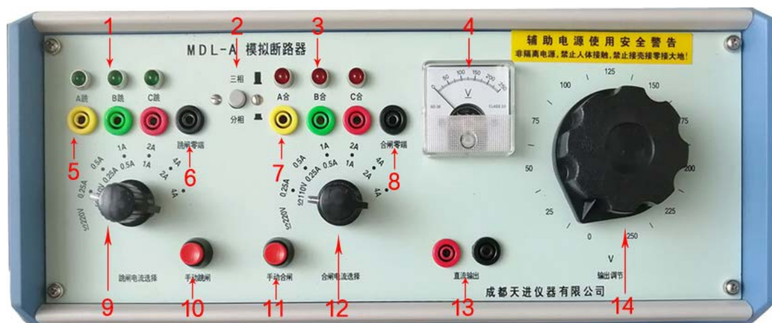
图-1 MDL-A 仪器面板功能